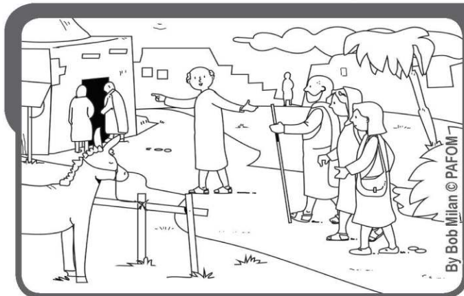
Matka Jezusa i Jego krewni szukają Go, ponieważ chcieliby z nim porozmawiać.

„Bo kto pełni wolę Ojca mego, który jest w niebie, ten mi jest bratem, siostrą i matką” (Mt 12,50).