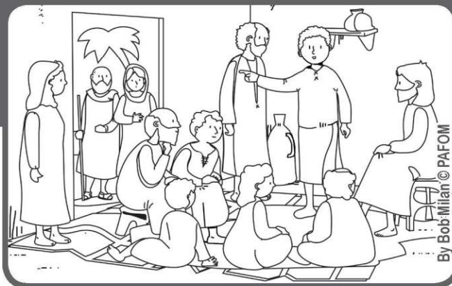
Apostołowie mówią do Jezusa: na zewnątrz jest Twoja matka i Twoi bracia, którzy chcą z Tobą rozmawiać.