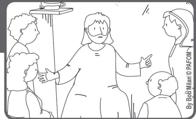
Jezus wskazując na uczniów odpowiada: kto czyni wolę mego Ojca, który jest w niebie, ten jest mi bratem, siostrą i matką.